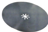
Empreinte 1 à 5 Sorties